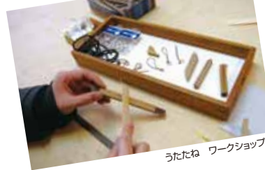
うたたね ワークショップ